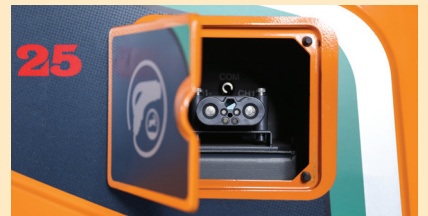
▲ 간편하고 신속한 충전 가능